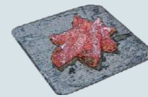
ミラノサラミ Salame Milano