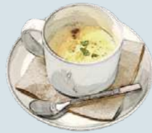
本日の一口スープ Today's Soup