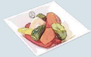
彩り野菜のピクルス Pickles