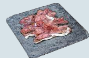
パルマ産プロシュート Prosciutto Parma