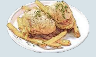
フィッシュアンドチップス Fish and Chips