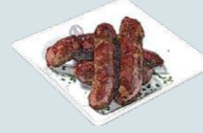
メキシカンチョリソー (4ピース) Chorizo