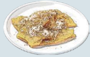
パネッレ Chickpeas Frit