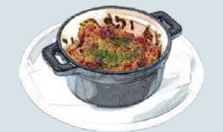
イベリコ豚のチリコンカルネ Chili con Carne