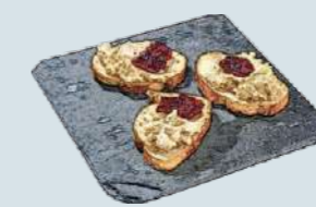
フォアグラムの ブルスケッタ Foie Gras Mousse