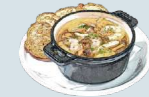
小エビとキノコのアヒージョ Ajillo