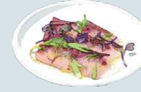
鮮魚のカルパッチョ Today's Carpaccio