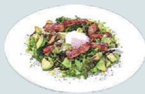
シーザーサラダ Ceaser Salad 1,600