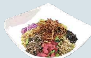
チョップドサラダ Chopped Salad 1,200