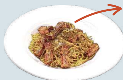
厚切りベーコンのカルボナーラ Carbonara 1,600