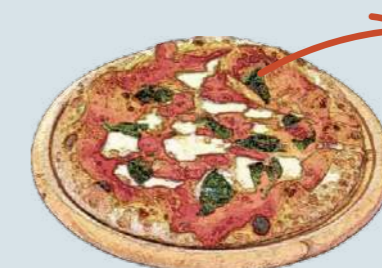
マルゲリータ Margherita 1,400