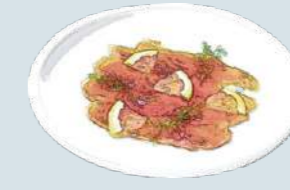
サーモンマリネ Marinade Salmon