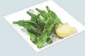
ししとうフリット Sweet Green Pepper Frit