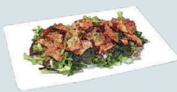
タコと海藻のサラダ Octopus & Seaweed Salad 1,200